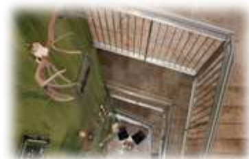
Zu guter Letzt (Geschäftsbedingungen) 16