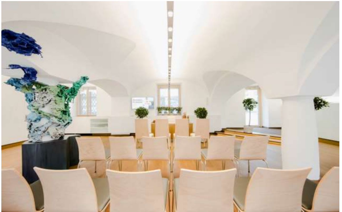
Standesamtliche Trauung im „Boarbäck Haus“ in Stainz