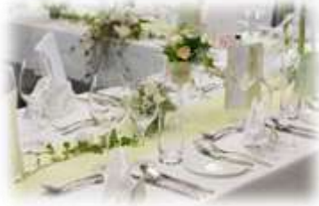
Der Stainzerhof stellt sich vor (Räumlichkeiten) 5 - 6