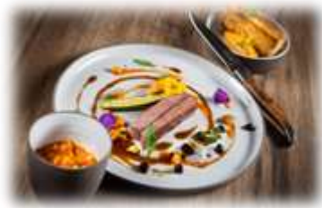
Weil man es schmeckt! (Küchenlinie, Menüvorschläge) 8 - 10