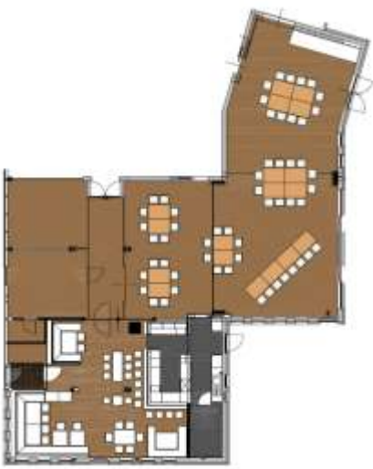
Tafel für 56 Personen