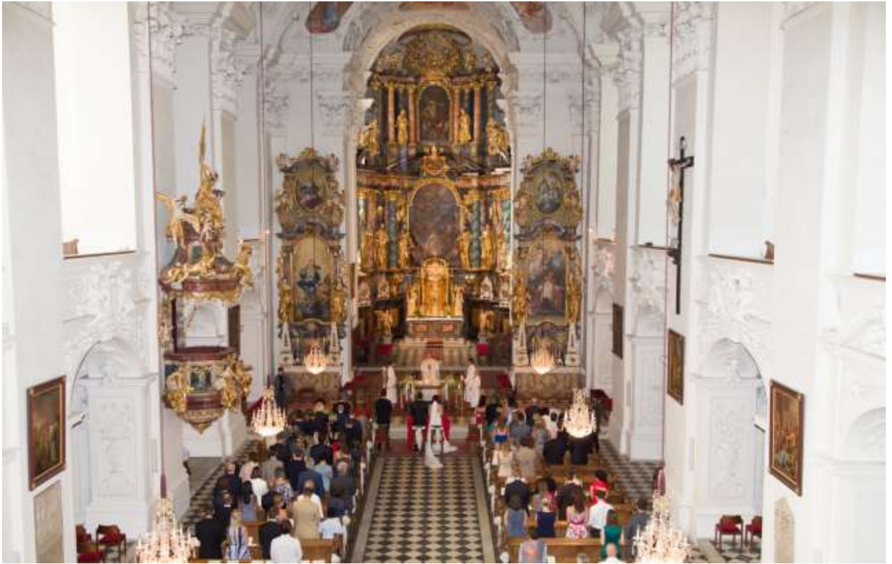
Kirchliche Trauung im Schloss Stainz