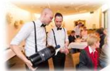
Planung ist das halbe Leben (Kontakte, Checkliste) 13 - 15