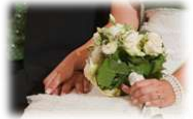
Eine perfekte Hochzeit (Vorschlag für Ihren Tag) 7