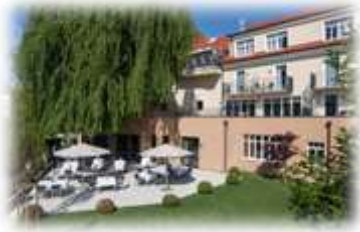
Impressionen (Stainzerhof, Kirche, Standesamt) 1 - 4