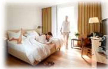
Himmlische Träume (Das Hotel) 11 - 12